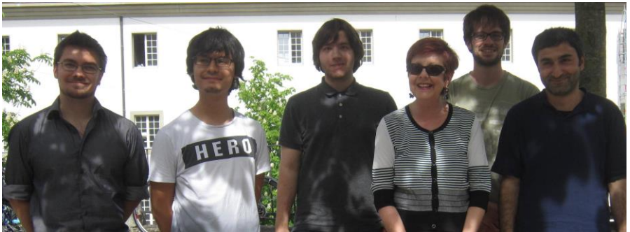
Personnel de la bibliothèque SCANT – 2015

10.4 Bâtiments : la porte d'entrée principale est en cours de restauration et de modification –ouverture automatique- depuis novembre 2015. Une porte coulissante intérieure a déjà été installée. La remise en place de la porte d'entrée se fera durant le premier trimestre et l'accès en dehors des heures d'ouverture sera assuré par la Campus Card. La liste des personnes autorisées a été définie par l'administration de l'Université.